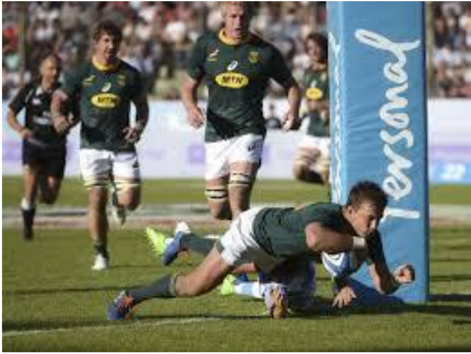
Imagen 1: Traumatismo en jugador de rugby

Revisión de los jugadores de rugby intervenidos por rotura del tendón distal del biceps, tratados quirúrgicamente con doble abordaje y fijados con el sistema Toggleloc (Zimmer). (Imagen 1)